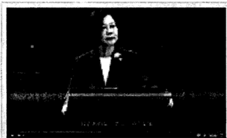
蔡英文總統今日接見「第25屆全國十大傑出愛心媽媽慈暉獎」得獎人暨家屬，表彰每位傑出愛心媽媽的奉獻與付出。

〔記者蘇永耀／台北報導〕總統蔡英文今日接見「第25屆全國十大傑出愛心媽媽慈暉獎」得獎人暨家屬，表彰每位傑出愛心媽媽的奉獻與付出，讓社會更瞭解身心障礙者家庭的困境，並聆聽愛心媽媽的心聲，也說明政府推動照顧身心障礙者政策的努力，強調未來要不斷加強改革的力道，持續消除有形、無形的障礙，落實身權公約精神，讓身障朋友獲得更好的照顧。