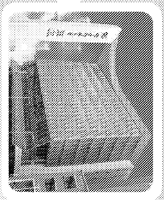
▲ 南臺科技大學大門照