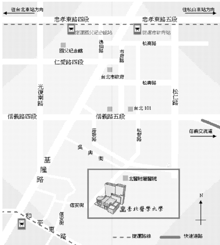
臺北醫學大學交通位置圖：