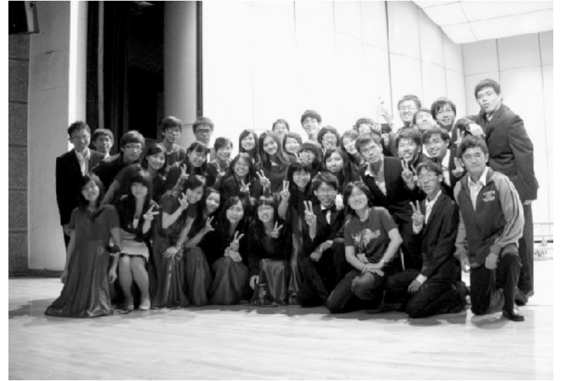
民國100年(2011)主辦第34屆十醫·於中山大學逸仙館