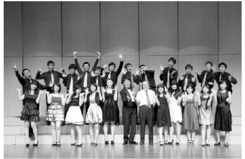
民國101年(2012)·於至善廳與高師大音樂系合唱團演出悅音之夜音樂會