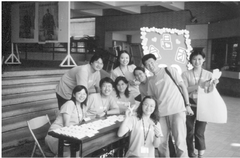
民國91年·第35屆團圓日·校友們五年一次的盛大聚會