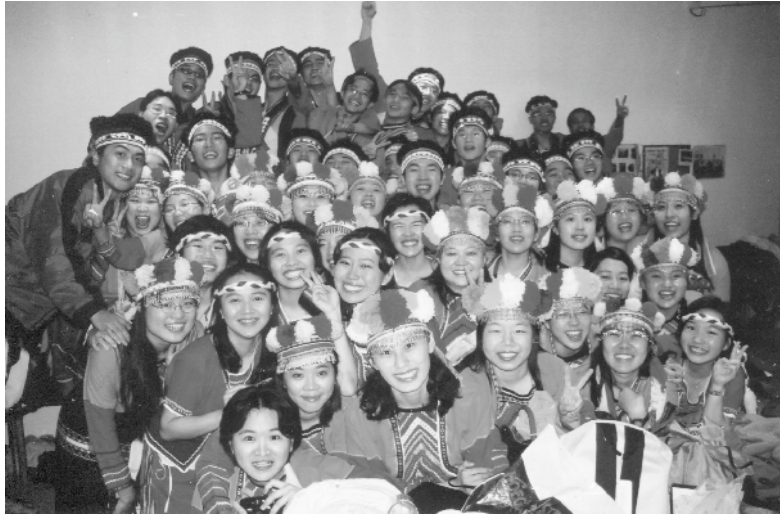
以原住民歌舞征服德國與日本聽眾的高醫合唱團