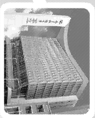
▲ 南臺科技大學大門照