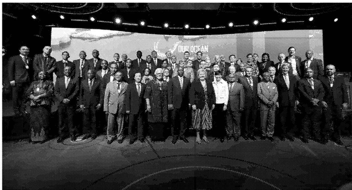
圖說／「我們的海洋會議」合照（2019年）

對海洋做出承諾，讓海洋永續發展，是全世界皆應努力的方向。本篇介紹已舉辦6屆的「我們的海洋會議」，介紹全球致力於海洋保育，互相分享經驗，提供看法，並起身行動的努力。