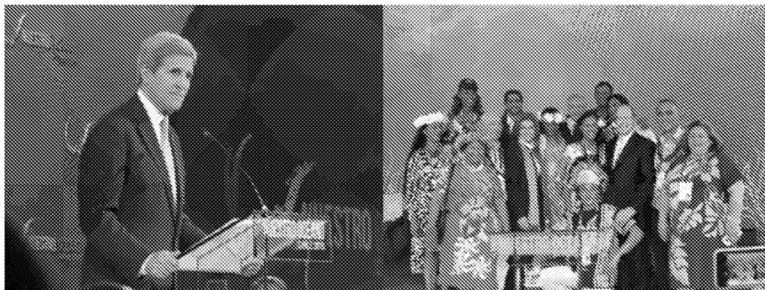
圖說／2015年「我們的海洋會議」於智利舉辦，美國國務卿凱瑞於會議上發言（左），智利復活島原住民與外交部長等慶賀通過海洋保護區（右）

此波對海洋的熱愛逐漸擴散，2015年於智利瓦萊帕萊索、2016年於美國華府、2017年於歐盟馬爾他、2018年於印尼峇里島、2019年於挪威奧斯陸，接下來2020年8月將於帛琉舉辦第7屆會議，在此讓我們回顧這6年所累積的資產。