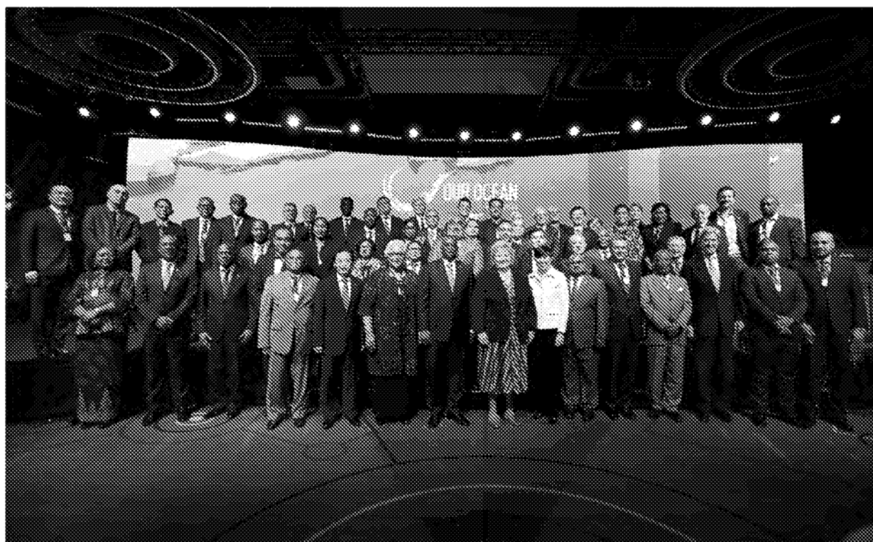
Group photo at the Our Ocean Conference (2019)

Committing to a sustainable ocean is the direction towards which the world should strive. This article introduces the Our Ocean Conference, an event which is in its 6th year. The event highlights the world's dedication to ocean conservation, sharing of experience, providing opinions, and efforts in taking action.