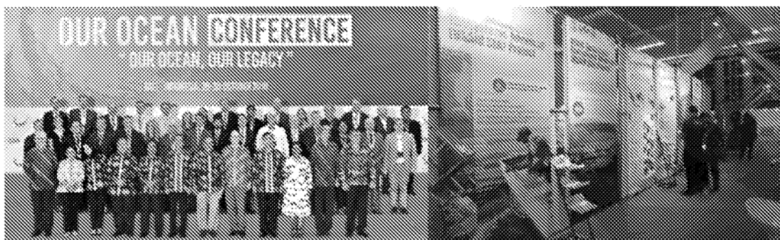
圖說／2018年印尼會議，左為出席高層官員，右為會外展覽場館