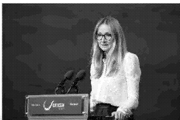
Alexandra Cousteau delivering her speech

"In the decades that have passed, I've watched the place I loved as a child filled with ghosts. Coral reefs have disappeared. Fisheries have shrunk. ...Communities have lost their livelihoods. And ocean conservation and restoration remained underfunded and largely ignored. Our window for creating the change we need rebuild our oceans is shrinking. We are out of time, and so I thank you for your commitments and your ambition here at this conference. My children will be my age by 2050. They are eight and four today. And as the fourth generation of ocean conservation in my family, they might be the generation of my family that write the obituary for the ocean, so I employ you to think of your children with every decision that you make. Think about how your decisions will impact their lives and let them be the ultimate beneficiaries of the work that you do."