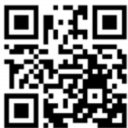
比賽辦法及報名表

※比賽辦法請掃描QR-Code或至 本局資訊網站查詢。 ( https://reurl.cc/b5mZ53 )