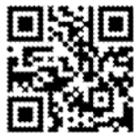
比賽網頁 QR 碼