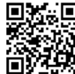
報名表單 QR 碼