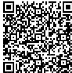
青少年組樂團報名連結