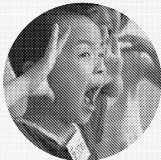
02 | 第二區隊 - 草嶺地質生態國小 肢體開發