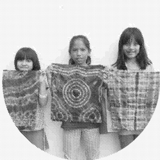
03 | 第三區隊 - 民權國小 藍染課程