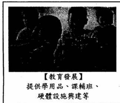
【教育發展】 提供學用品、課輔班、 硬體設施興建等