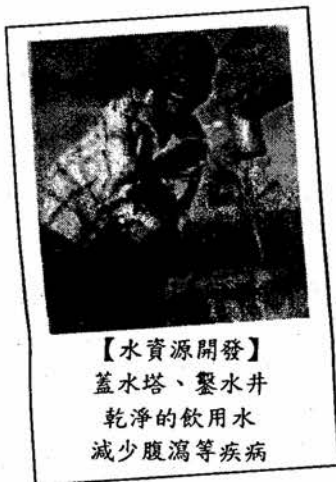
【水資源開發】 蓋水塔、鑿水井 乾淨的飲用水 減少腹瀉等疾病