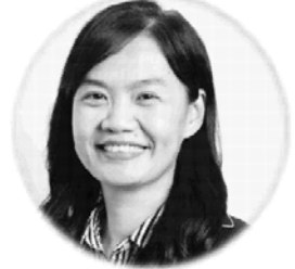
潘秀玲 院長/教授 臺北醫學大學