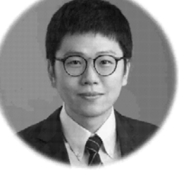
胡尚秀 教授 清華大學