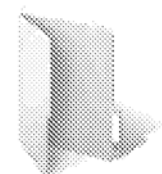
人文感動-高中組- 沈加毅-那些年

組別『人文感動』、『風景旅遊』、『創意攝影』(請擇組別-高中組/大專組) - 參賽者名字-作品主題 其檔案命名方式為如