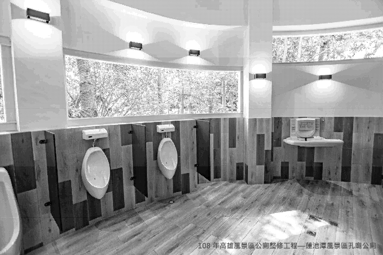
108年高雄風景區公廁整修工程—種池潭風景區孔廟公廁