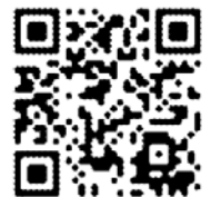
學生社團優秀 輔(指)導老師