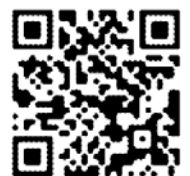
學生社團優秀幹部