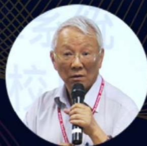
臺灣認知神經科學暑期學校 創辦人 中央研究院 曾志朗院士