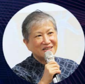
臺灣認知神經科學暑期學校 校長 國立中央大學認知神經科學研究所 洪蘭講座教授