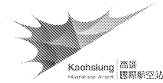
圖1、加註指定單位 logo 範例

微電影參賽影片”，即完成報名作業與作品繳件。參賽者若為未具完全行為能力人(即未滿18歲)，應寄送「法定代理人同意書」正本(附件4)，未補繳者將喪失參賽資格。