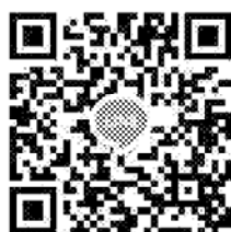
競賽 Line 群組