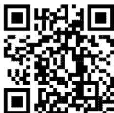
線上報名 QR code