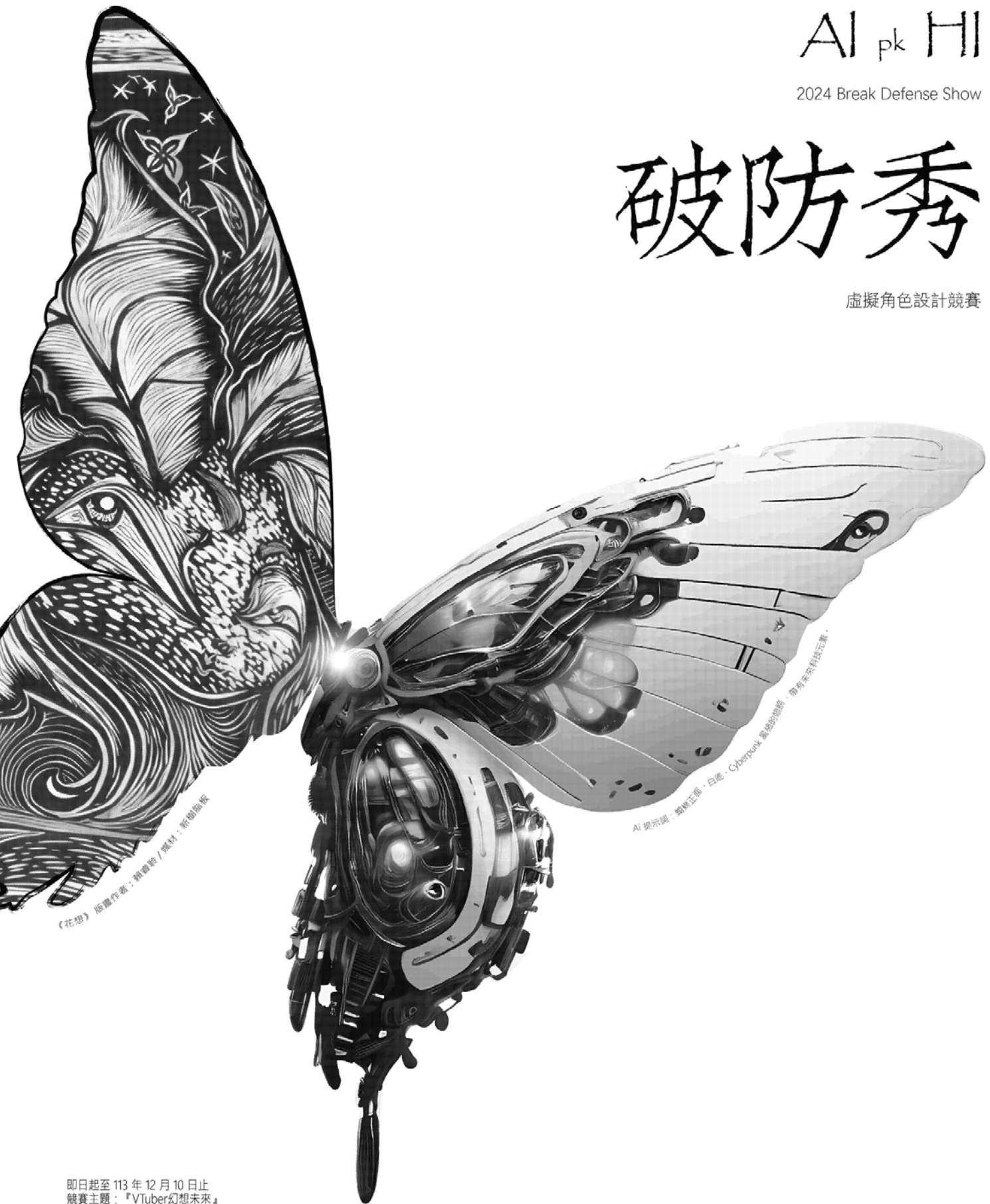
《花想》 版權作者：熱會臉 / 攝影：新樹攝影