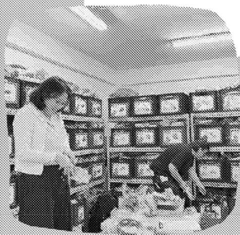
實地參訪玩具圖書館