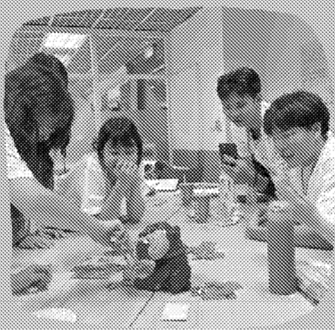
學員交流 × 教學設計