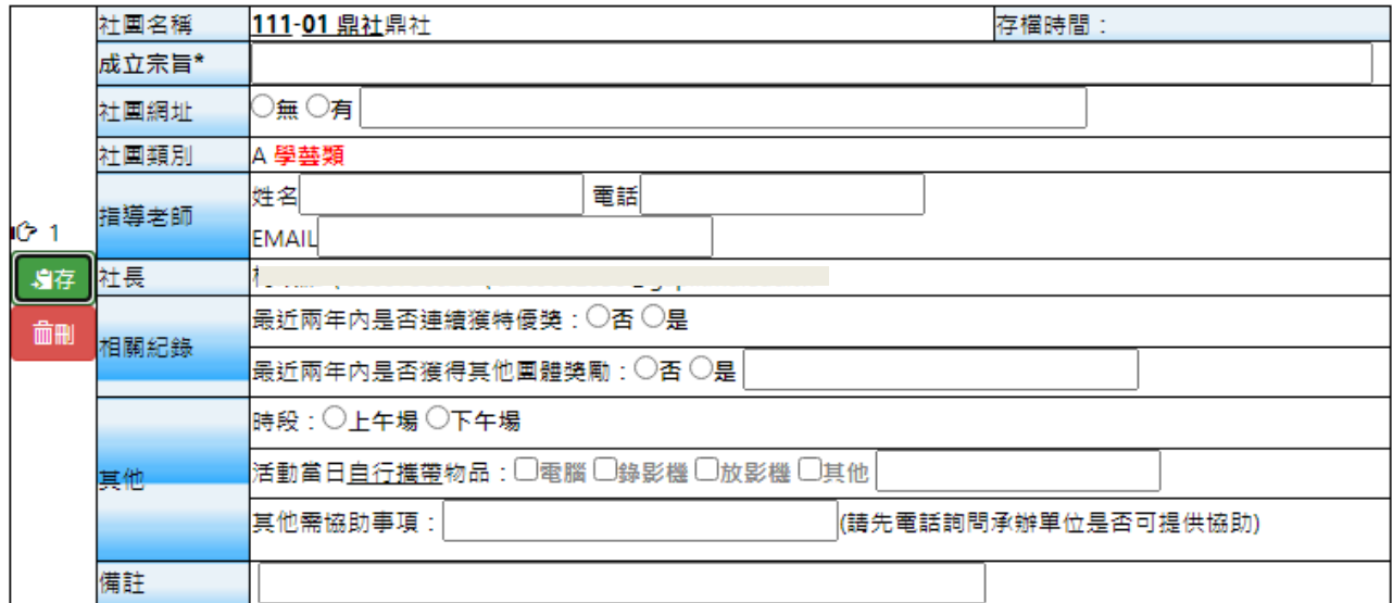
學生社團評鑑報名表

【步驟 2】登錄後即可看到所屬社團頁面(只有社團負責人才有權限)，並將報名表資料填寫完畢，社團指導老師請填校內輔導老師即可，社團網址請務必填寫可公開之網頁，以利課外組查核網頁更新情形。